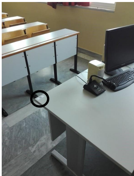
Εικόνα 2 (αίθουσα Δ:0.09)

Ο/Η διδάσκων/ουσα θα σαρώνει τον QR κωδικό που βρίσκεται στην έδρα (βλ. Εικόνα 2) και αντιπροσωπεύει την αίθουσα συνολικά ώστε να έχει εποπτική εικόνα των θέσεων των φοιτητών/ριών μέσα στην αίθουσα.